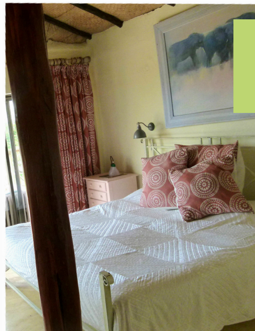
OL PEJETA Pelican House